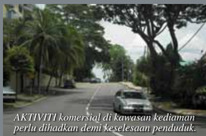
AKTIVITI komersial di kawasan kediaman perlu dihadkan demi keselesaan penduduk.

Kerja membersihkan longkang di situ mengambil masa hampir lima jam.