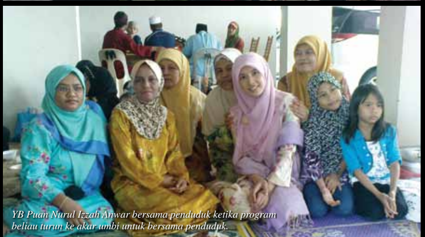
YB Puan Nurul Izzah Anwar bersama penduduk ketika program beliau turun ke akar umbi untuk bersama penduduk.