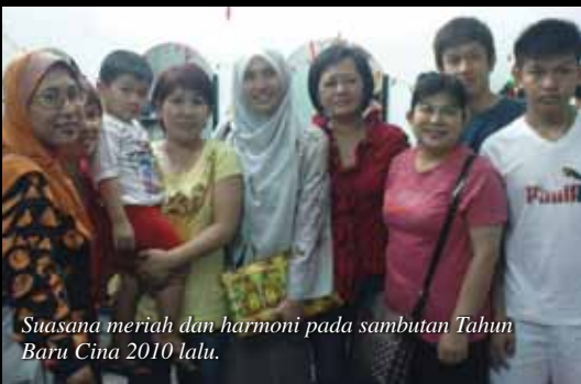
Suasana meriah dan harmoni pada sambutan Tahun Baru Cina 2010 lalu.