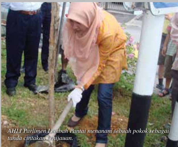
AHLI Parlimen Lembah Pantai menanam sebuah pokok sebagai tanda cintakan kehijauan.