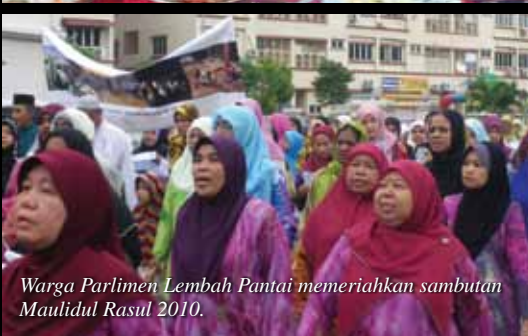
Warga Parlimen Lembah Pantai memeriahkan sambutan Maulidul Rasul 2010.