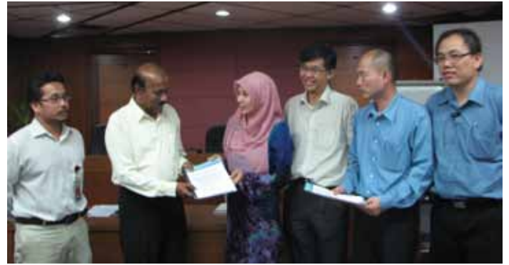
Lapan Ahli Parlimen Pakatan Rakyat menyerahkan memorandum kepada Suhakam bertempat di Tingkat 29, Menara Tun Razak, pada 29 Januari 2010 berhubung kejadian siri serangan provokatif terhadap rumah ibadat di beberapa negeri.

Dalam kenyataan lain, beliau menyifatkan semua tindakan provokatif itu bertujuan mewujudkan ketegangan antara kaum dan agama di negara ini.