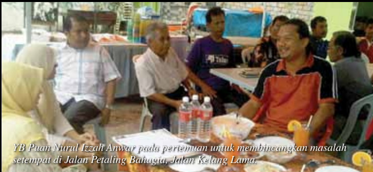
YB Puan Nurul Izzah Anwar pada pertemuan untuk membincangkan masalah setempat di Jalan Petaling Bahagia, Jalan Kelang Lama.