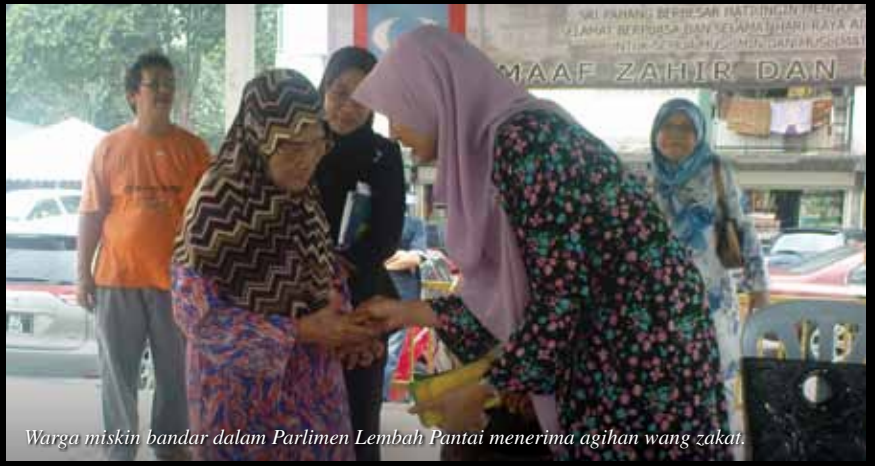
Warga miskin bandar dalam Parlimen Lembah Pantai menerima agihan wang zakat.