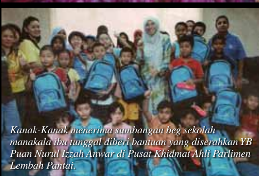
Kanak-Kanak menerima sumbangan beg sekolah manakala ibu tunggal diberi bantuan yang diserahkan YB Puan Nurul Izzah Anwar di Pusat Khidmat Ahli Parlimen Lembah Pantai.