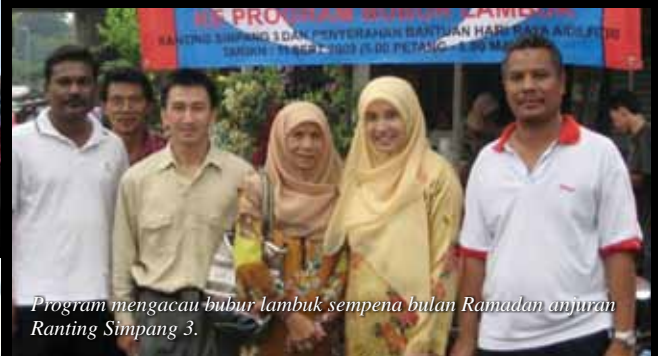
Program mengacau bubur lambuk sempena bulan Ramadan anjuran Ranting Simpang 3.