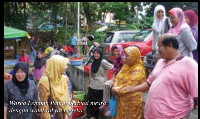
Warga Lembah Pantai berbual mesra dengan wakil rakyat mereka.