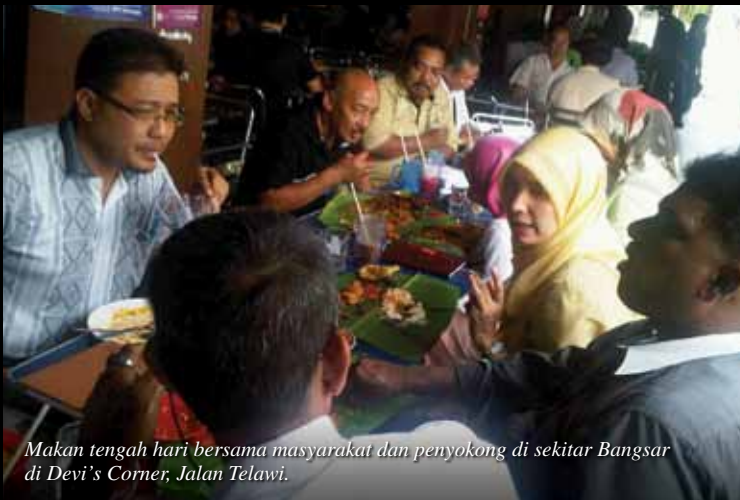
Makan tengah hari bersama masyarakat dan penyokong di sekitar Bangsar di Devi's Corner, Jalan Telawi.