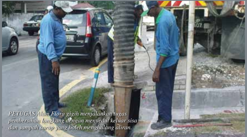
PETUGAS Alam Flora gigih menjalankan tugas pembersihan longkang dengan menyedut keluar sisa dan sampah sarap yang boleh menghalang aliran.

P ENGUSAHA restoran dan gerai makan serta orang ramai mesti menyuburkan lagi sikap menyayangi alam sekitar dengan tidak membuang sampah atau sisa ke dalam longkang kerana perbuatan itu akan menyebabkan saliran tersumbat dan punca banjir kilat setiap kali hujan.