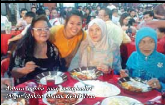
Antara tetamu yang menghadiri Majlis Makan Malam KeADILan.