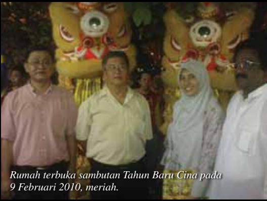
Rumah terbuka sambutan Tahun Baru Cina pada 9 Februari 2010, meriah.