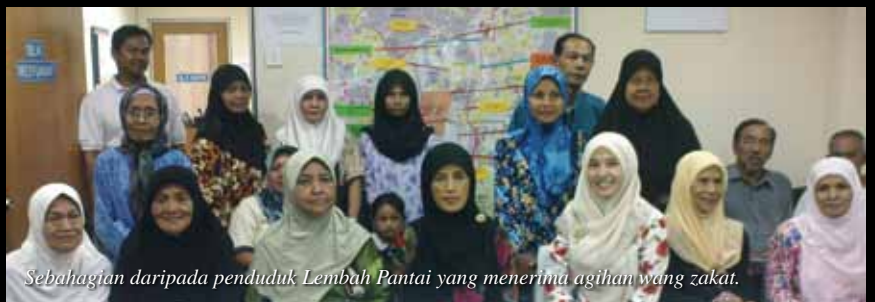
Sebahagian daripada penduduk Lembah Pantai yang menerima agihan wang zakat.