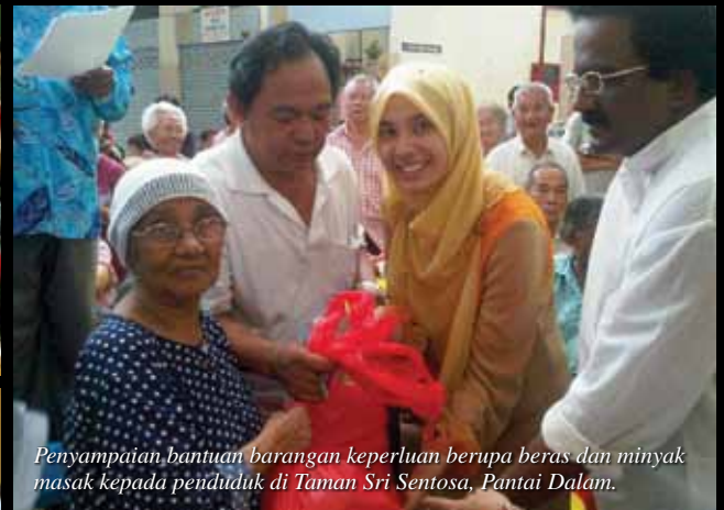
Penyampaian bantuan barangan keperluan berupa beras dan minyak masak kepada penduduk di Taman Sri Sentosa, Pantai Dalam.